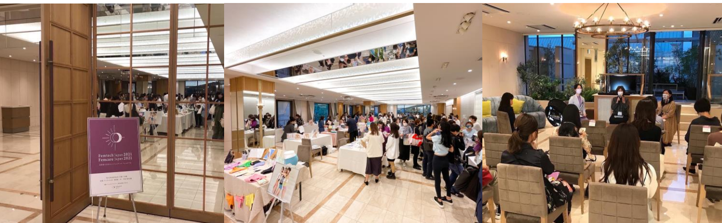
写真は2021年10月開催時の様子 / 左から入口、メイン会場、セミナー会場

会場内にてフェムテック、フェムケア、女性の健康課題解決へ向けたセミナーも実施します。出展者概要、セミナー概要については上記「Peatix」ページ内でご確認ください。