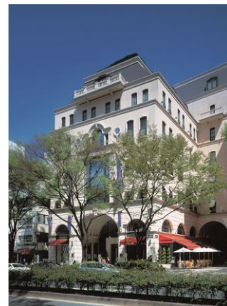
写真は「アニヴェルセル 表参道」の会場内および外観の様子